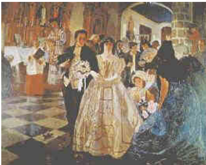
BODA DE MARIA TERESA RODRÍGUEZ DEL TORO Y SIMON BOLIVAR PINTURA QUE SE ENCUENTRA EN LA CASA NATAL DEL LIBERTADOR