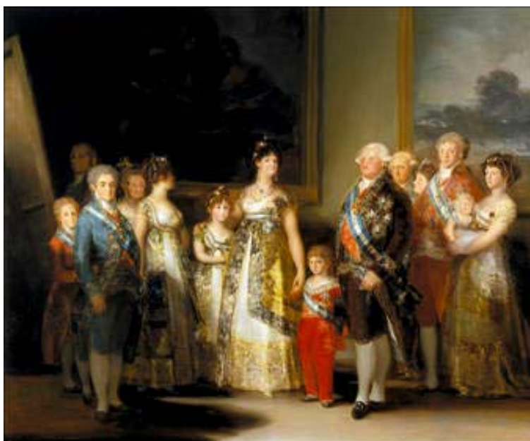
LA FAMILIA DE CARLOS IV. FRANCISCO DE GOYA MUSEO DEL PRADO, MADRID