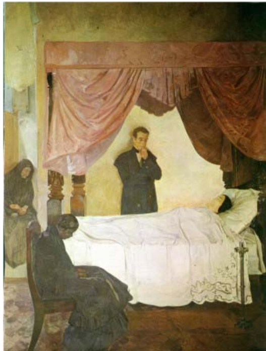
MUERTE DE LA ESPOSA DE BOLIVAR TITO SALAS 1929 CASA NATAL DEL LIBERTADOR

“... Viendo a su esposa tendida en el estrecho féretro, en el salón principal de la casa donde ya había comenzado a brillar, el único sentimiento del joven sería ese “parece mentira”, tan absurdo y a la vez tan legítimo, con que solemos comentar la muerte de los seres queridos. La habían vestido después de su muerte con un rico traje de brocado blanco y su cabeza reposaba sobre el faldellín con que su esposo había sido bautizado. Tenía apenas veintiún años, y antes de enfermar sus facciones conservaban todavía la frescura de la donceller...” (112)