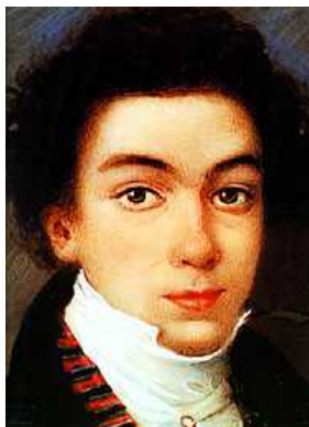
SIMON BOLIVAR REALIZADA POR AUTOR DESCONOCIDO EN MADRID ENTRE 1799 Y 1802 MUSEO FUNDACION JOHN BOULTON, CARACAS

Simón llega a Madrid el 10 de junio y se instala junto a su tío Esteban en la casa de Manuel Mallo hasta que ese mismo año llega su tío Pedro y los tres se mudan a la calle Los Jardines. (59)