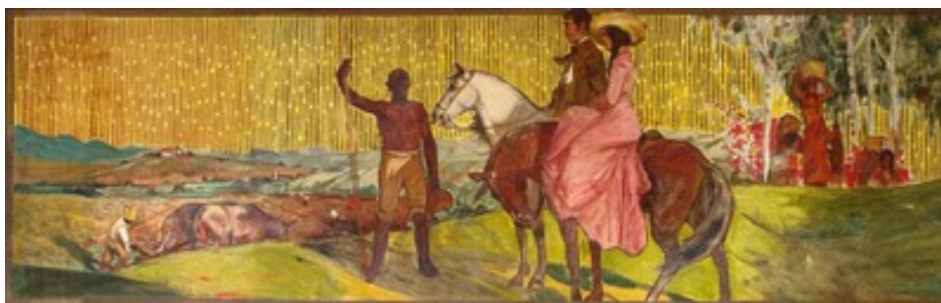
SIMON BOLIVAR MONTANDO CABALLO CON SU ESPOSA MARIA TERESA EN LOS VALLES DE ARAGUA PINTURA QUE SE ENCUENTRA EN LA CASA NATAL DEL LIBERTADOR

María Teresa llena a cabalidad las exigencias emanadas de su alto rango social. En las fiestas patronales de San Mateo, bajo la majestad del sol tropical, o en las frescas tardes avileñas, su estilizada silueta tocada con la mantilla blanca, destaca un alto temperamento de mujer. Nadie le aventaja en sentimientos piadosos ni en espíritu de confraternidad...” (109)